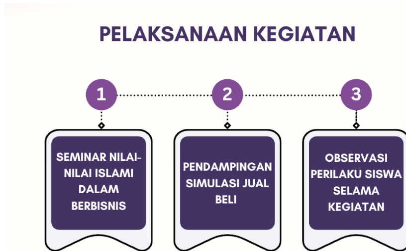
Gambar 6. Pelaksanaan Kegiatan