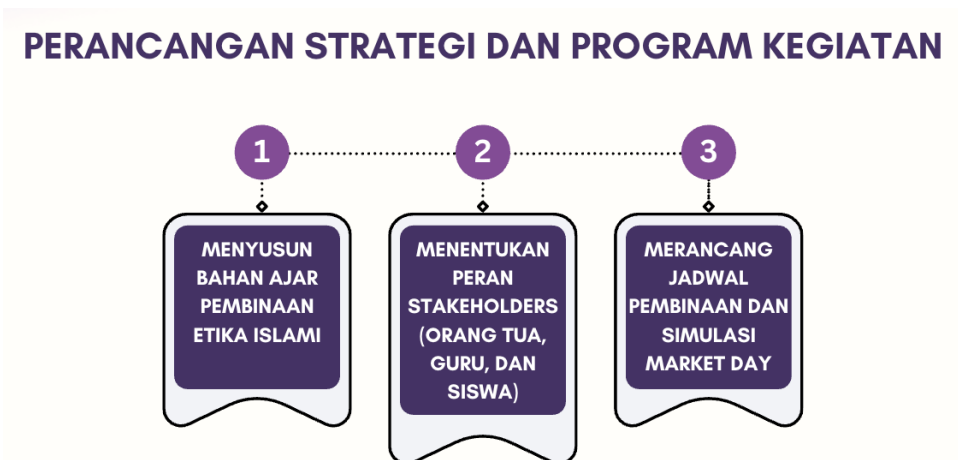
Gambar 3. Perancangan Strategi dan Program Kegiatan

Fase selanjutnya adalah merancang strategi dan program kegiatan yang dilaksanakan oleh tim pengabdian. Adapun prosesnya terlihat pada gambar 2. Tahapan ini berfokus pada penyusunan rancangan kegiatan secara konkret berdasarkan aset dan potensi yang telah dirumuskan sebelumnya. Kegiatan ini meliputi: