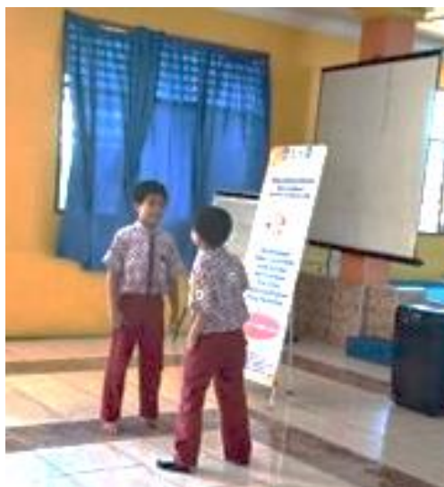
Gambar 5. Simulasi Dialog Jual Beli