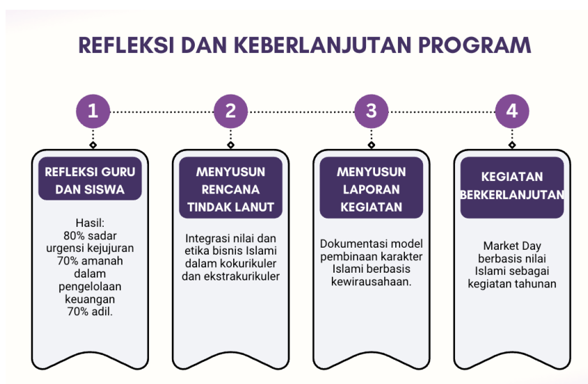
Gambar 7. Refleksi dan Keberlanjutan Program

Hasil kegiatan menunjukkan bahwa pembinaan etika bisnis Islam untuk program etika bisnis Islam untuk program young market day dapat menjadi media yang efektif dalam menginternalisasikan nilai-nilai Islam. Melalui pengalaman langsung, siswa memperoleh pengetahuan tentang konsep etika bisnis Islami, bukan hanya dari ceramah tetapi juga dari praktik nyata yang menyenangkan. Temuan ini sejalan dengan yang menyebutkan bahwa pengintegrasian nilai-nilai Islam ke dalam pembelajaran berbasis kontekstual dapat memperkuat karakter Islami dan sosial siswa sekolah dasar.