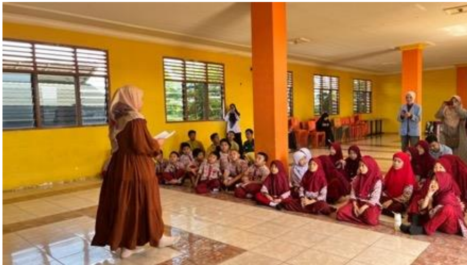
Gambar 4. Seminar Etika Bisnis Islam