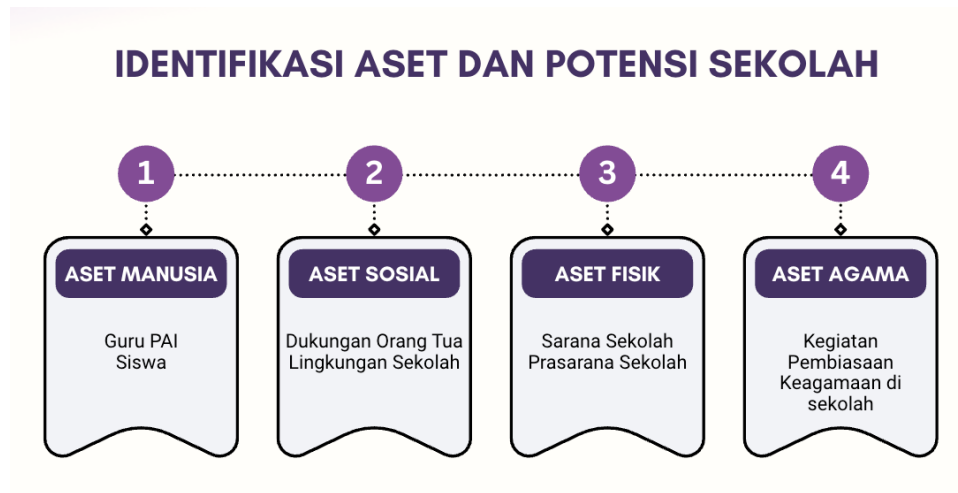
Gambar 2. Identifikasi Aset dan Potensi Sekolah