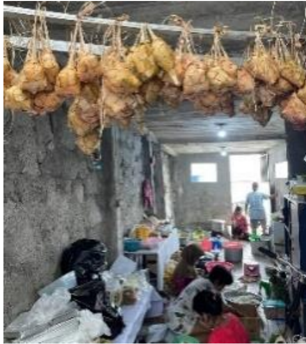
Gambar 1. Kondisi UMKM Annisa 36

Analisis situasi Candi Losmen merupakan sebuah kawasan permukiman padat yang berada di wilayah Kelurahan Candi, Kecamatan Candisari, Kota Semarang, Jawa Tengah. Secara administratif, Kelurahan Candi memiliki luas sekitar 0,68 km 2 dan terdiri dari 11 RW dan 68 RT. Candi Losmen terletak di bagian selatan kelurahan ini dan menjadi salah satu lingkungan dengan kepadatan penduduk yang tinggi. Wilayah Candi Losmen berada di tengah kawasan perkotaan Semarang dan berbatasan dengan beberapa kelurahan strategis. Di sebelah Utara berbatasan dengan Kelurahan Wonodri, sebelah Timur dengan Kelurahan Jomblang dan Peterongan, sebelah Selatan: Kelurahan Kaliwiru dan sebelah Baratnya adalah Kelurahan Tegalsari dan Wonotingal.