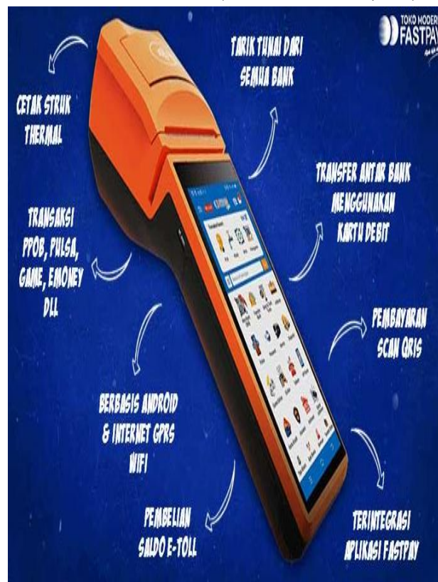
Gambar 3. Mesin EDC ( Electronic Data Capture )

Alat EDC dirancang sebagai solusi transaksi digital yang komprehensif dan serbaguna. Dengan sistem berbasis Android dan koneksi internet melalui GPRS maupun WiFi, alat ini memungkinkan pengguna untuk melakukan berbagai layanan keuangan dan pembelian dengan mudah. Beberapa fitur utamanya meliputi: